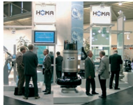
НОМА на интернациональных выставках: во всём мире рядом со всеми потребителями.