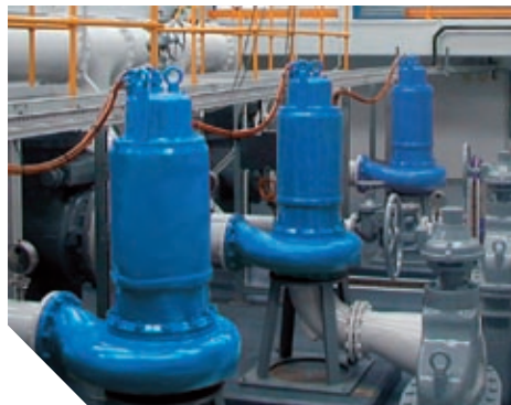
Канализационные насосные станции с погружными двигателями для сухой установки.