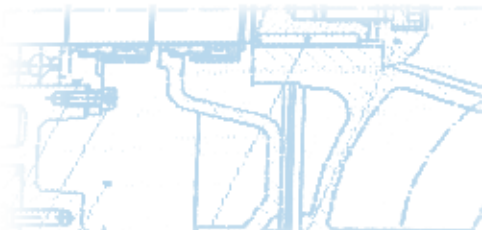
Главная фабрика и офис НОМА в Нойнкирхен Сельшайд – производственный и дистрибуторский центр.

Мы выберем наилучшее решение для наших клиентов как с технической, так и с экономической точки зрения.