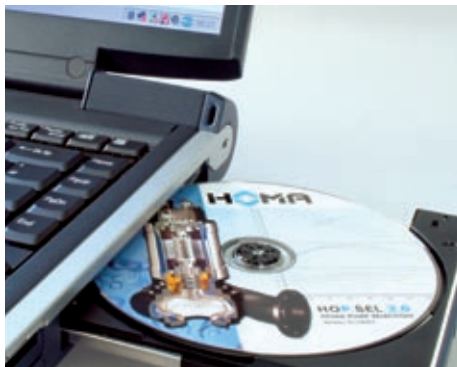
Программы по настройке можно скачать через интернет или получить на компактном диске.